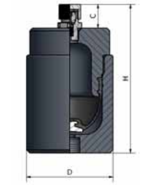
Disegno/ Drawing N° 1