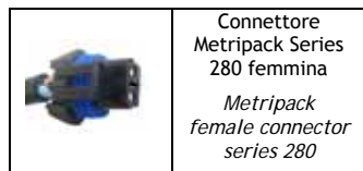
Connettore Metripack Series 280 femmina Metripack female connector series 280